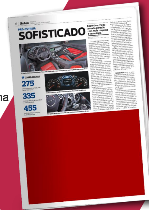
½ Página 15 Fotos