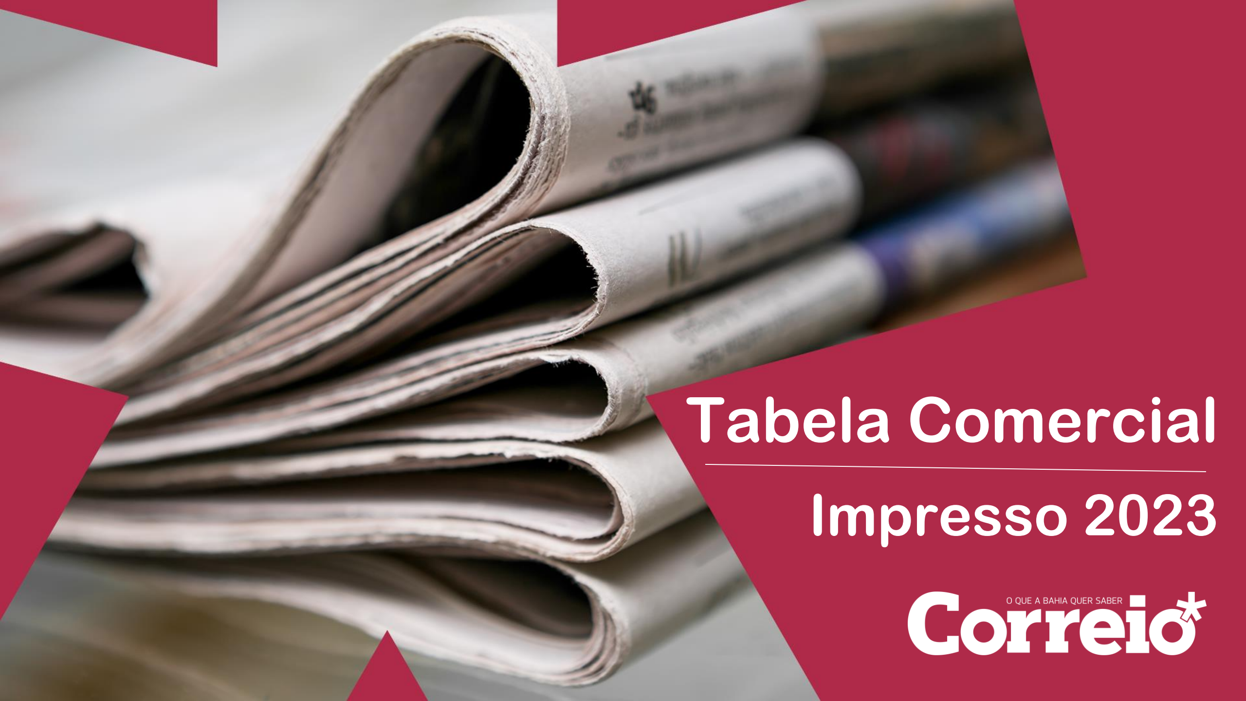
Tabela Comercial Impresso 2023