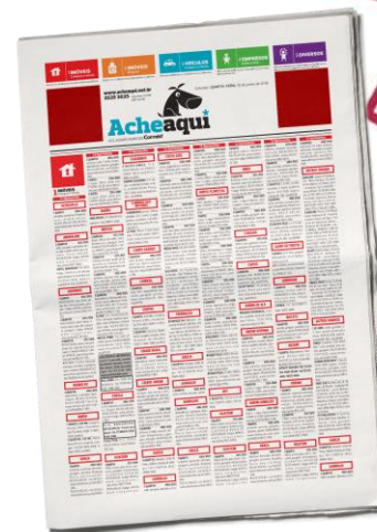
Retranca de capa 4,5 x 05 cm