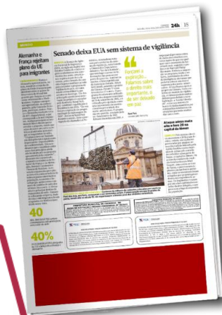
Rodapé | 5 col x 7cm