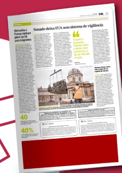
Rodapé de Página | 5 col x 7 cm