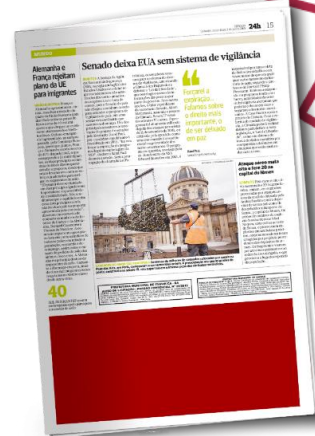
Rodapé | 5 col x 10cm