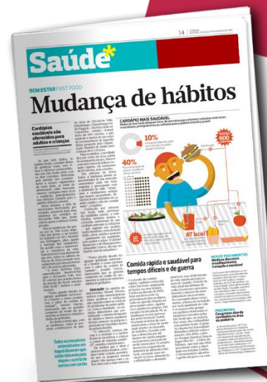
Selo Mezanino 2 col x 3 cm

Acréscimo de 30% para anúncios coloridos. Para veiculação mensal, mínimo de 24 inserções/mês Para veiculação semanal, mínimo de 4 inserções/mês A veiculação de Rodapé Capa refere-se a: mensal – Caderno AcheAqui e semanal - Cadernos Autos.