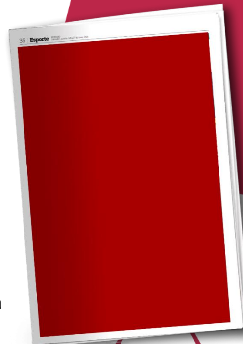
1 Página 35 Fotos

Tabela válida exclusivamente para revendas, lojas de autopeças e acessórios automotivos. Acréscimo de 30% para anúncios coloridos.