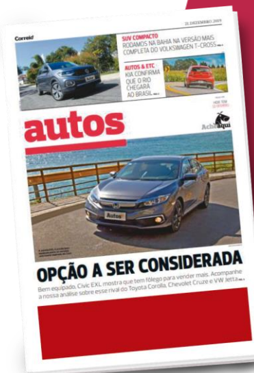
Rodapé de Capa

A veiculação de Rodapé Capa refere-se a: mensal – Caderno Acheaqui e semanal - Cadernos Autos.