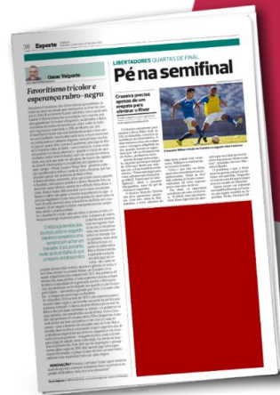
¼ Página | 3 col x 19cm