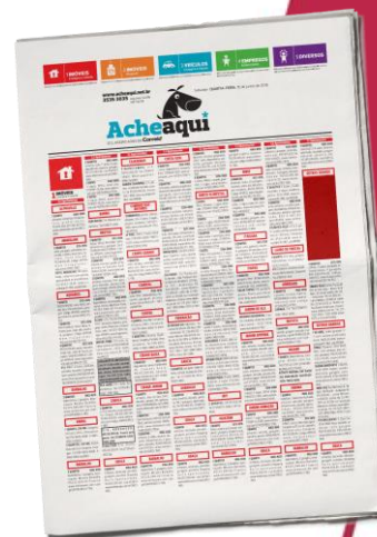
Patrocínio de retranca 1 col x 08 cm