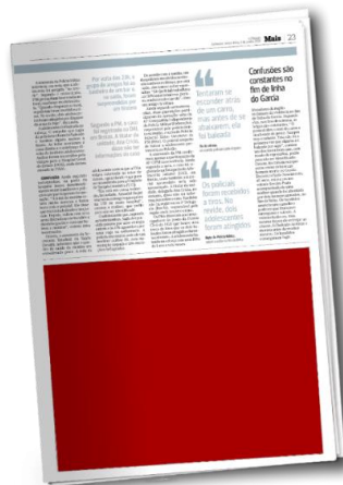
½ Página | 5 col x 19cm