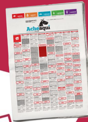
Patrocínio de retranca 1 col x 04 cm