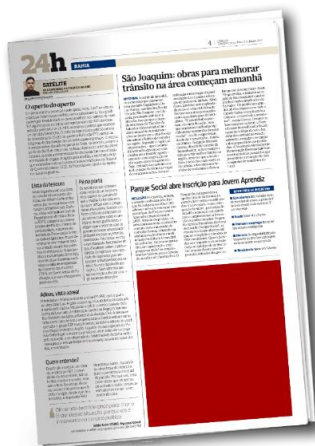
Selo | 3 col x 15cm